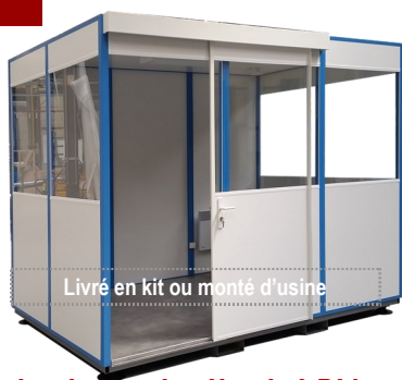
Livré en kit ou monté d'usine