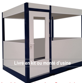
Livré en kit ou monté d'usine